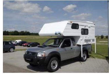
Six-Pac auf Nissan

In Zusammenarbeit mit unserem Partner, dem Autohaus Baur , bieten wir nun auch die Vermietung von Wohnkabinen an. Zur Auswahl stehen neben einer Four-Wheel Eagle und einer Six-Pac Favorite FD auch auf Wunsch Pickup's der Typen Ford Ranger oder Nissan Navara . Weitere Informationen finden Sie auf unserer Homepage.