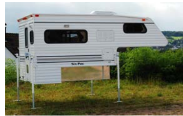
Die Six-Pac Favorite SL

2008 war für uns das Jahr großer Innovationen. Mit unserem amerikanischen Partner Six-Pac haben wir die Angebotspalette erweitert und bieten nun auch einige speziell für den deutschen Markt entwickelte Modelle an. Zum Beispiel haben wir nun die Six-Pac Favorite SL neu im Angebot. Diese kompakte Kabine ist für Doppelkabiner Pickups mit bis zu 150cm Ladefläche entwickelt worden und kann mit oder ohne Sanitärraum bestellt werden. Die ersten Kabinen dieses Typs sind in unserer Ausstellung zu besichtigen.