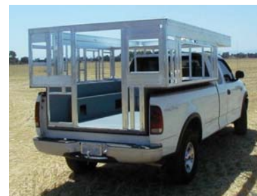
Der „flex-frame“ aller Four Wheel Camper

Zum 01.08.2008 hat Four-Wheel Campers auf die weltweit gestiegenen Rohstoffpreise und Produktionskosten reagiert. Die Basispreise für die Wohnkabinen wurden dementsprechend nach oben angepasst. Wir haben die Gelegenheit genutzt und auch hier vor dem 31.07.2008 neue Kabinen für unseren Lagerbestand bestellt. Diese sind schon als Modelljahr 2009 ausgeführt, haben aber noch den niedrigeren 2008er Preis. Es warten derzeit noch je eine Hawk , Finch und Eagle auf Sie.