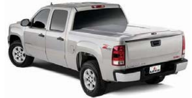
Leer Tonneau Cover